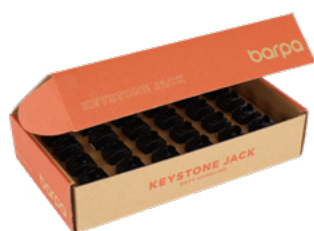
Caja de 24 Unidades

Estas imágenes son meramente ilustrativas. Queremos que vea la importancia que le damos al embalaje. Siempre trabajamos con productos y materiales que son fáciles de usar.