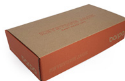
Caja de 12 Unidades - envasadas individualmente